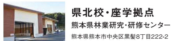
県北校・座学拠点 熊本県林業研究・研修センター 熊本県熊本市中央区黒髪8丁目222-2