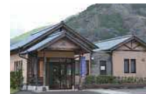
県南校・座学拠点 熊本県球磨郡五木村甲2672-40